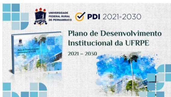
Imagem 5: Plano de Desenvolvimento Institucional