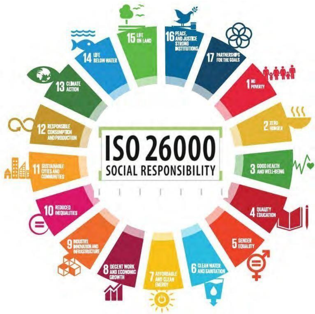
Imagem 4: ISO 26000 e AGENDA 2030