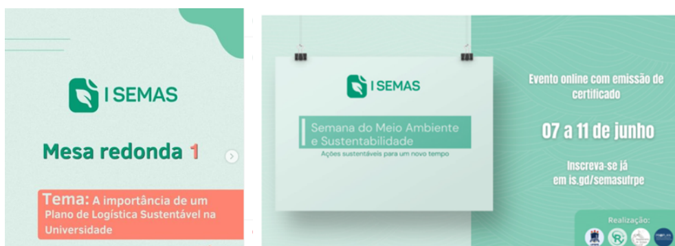
Figura 12- Semana do Meio Ambiente e Sustentabilidade