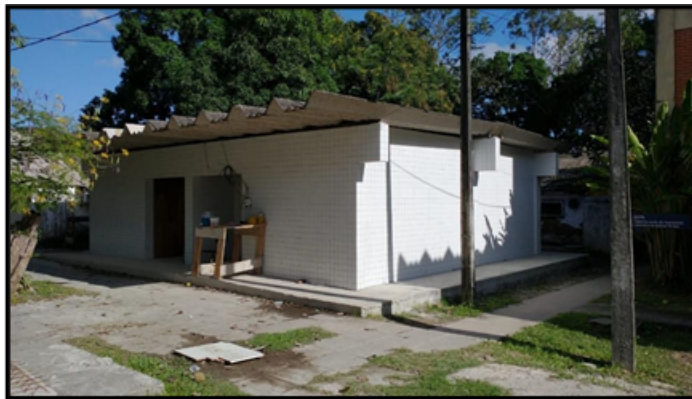
Figura 3- Banheiro Externo Departamento de Agronomia

A proposta foi a de elaboração de Projeto de captação e aproveitamento da água da chuva para o banheiro externo localizado no Departamento de Agronomia. Esta ação foi concluída com sucesso. Não apenas o projeto foi elaborado, mas a própria execução de implementação do sistema de aproveitamento de água da chuva foi iniciado.