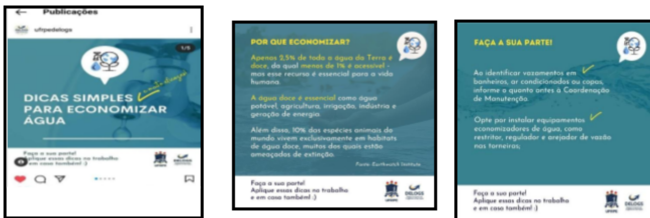
Figura 5- Publicações educativas sobre consumo consciente de água

Diversas postagens foram realizadas com o intuito de sensibilizar a comunidade acadêmica quanto ao uso racional da água; as campanhas foram realizadas no instagram do Departamento de Logística e Serviços com o tema “Dicas simples para economizar água”..